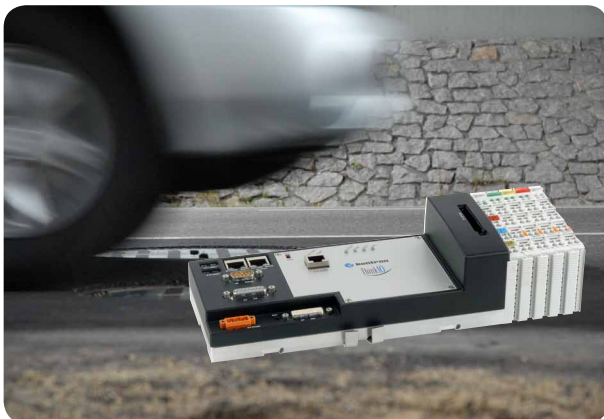
Bild 1: Beim Messverfahren ProContour H3-D mit ThinkIO-Duo werden Reifenprofiltiefen berührungslos bei bis zu 120 km/h fließendem Verkehr gemessen.

Mangelhafte Bereifung ist weltweit eine der häufigsten technischen Ursachen für Verkehrsunfälle: Reifen mit zu geringer Profiltiefe verringern bei Nässe oder Glätte die Fahrbahnhaftung. Die Folge sind verlängerte Bremswege. Auch die Gefahr des Aquaplanings steigt, das Fahrzeug schwimmt auf und wird unkontrollierbar. Eine Kontrolle der Profiltiefe führt die Polizei jedoch nur unregelmäßig in Stichproben durch. Eine dynamische Profilmessung kann dies grundlegend ändern: Im laufenden Verkehr könnten 100 Prozent aller LKW, Busse und PKW überwacht werden. Das Messsystem ProContour H3-D ist ein solches System. Es ist in mehreren Ausführungen erhältlich. Der Zulassungsprozess für eine Ausführung für gerichtsverwertbare Messungen ist bei der Physikalisch Technischen Bundesanstalt (PTB) bereits angelaufen. Damit wird eine nahezu 100%ige Überwachung kritischer Strecken für mehr Verkehrssicherheit möglich. Dazu misst es automatisch die Profiltiefe und Profilart und kann die Ergebnisse per Ethernet-Kabel oder WLAN bereitstellen, um so Warnanlagen, Schranken, Kamerasysteme oder gar Durchfahrsperrern anzusteuern.