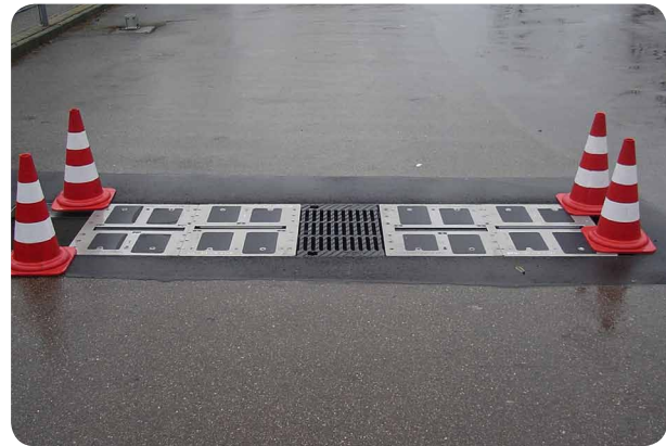
Bild 4: Je nach Anforderungen können bis zu 4 Messköpfe in Schächte oder U-Kanäle in die Fahrbahn eingelassen werden.

Neben der Reifenprofilfliefenmessung eignet sich das Messverfahren ProContour H3-D auch für weitere Anwendungsbereiche, bei denen es um die schnelle Erkennung von Oberflächenstrukturen geht. Interessant ist für ProContour dabei auch die Kontron-eigene RT-Linux Distribution. Die Distribution umfasst unter anderem Echtzeit Linux Treiberpakete des Open Source Automation Development Labs (OSADL). Um eine zum System passende Echtzeit-Konfiguration braucht sich ProContour deshalb keine großen Gedanken machen.