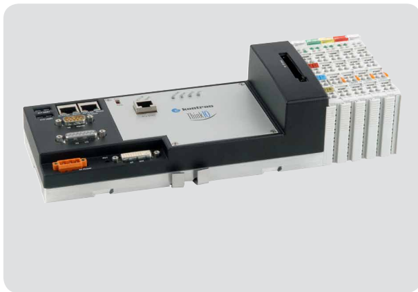
Bild 3: Der Kontron ThinkIO-Duo bietet ein umfangreiches Schnittstellenangebot, von Standard-PC- bis hin zu industriellen Feldbus- und -Ethernet-Schnittstellen in einer ultra kompakten Einheit, das optional mit dem modularen Wago IO System erweitert werden kann.

Die potenziellen Anwendungsfelder des ProContour H3-D sind vielfältig. Deshalb muss das eingesetzte System nicht nur schnell, sondern idealerweise auch vielfältig erweiterbar sein. So ist denkbar, dass das ProContour Messmodul mit anderen, bereits existierenden verkehrstechnischen Anlagen und Messsystemen verbunden wird. Sinnvolle Kombinationen sind beispielsweise Anzeigetafeln, Ampeln, Schrankensysteme, Mautstellen oder Wiegestationen für LKWs. Auch die Anbindung an zentrale Leitstellen ist denkbar. Viele Applikationen können einfach und kostengünstig über die vielfältigen Standard-Schnittstellen des ThinkIO-Duo eingebunden werden. Reicht das Standard-Featureset des kompakten Systems nicht aus, kann es optional flexibel mit dem Wago IO System modular erweitert werden.